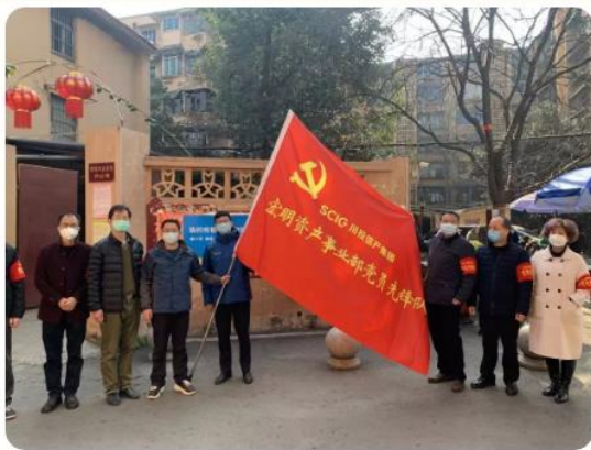
宏明资产事业部党员先锋队