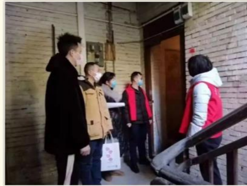
进家入户开展走访排查

仅用 40 小时开发疫情信息报告系统服务国内多地政府监控疫情、协助邳州民政开通养老服务热线电话问候关爱长者、组织党员职工成立服务队协助社区街道发放口罩、风雨兼程赴乐山街头为援鄂医疗人员家属送菜的智慧华川党员先锋队。