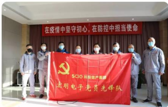
宏明电子党员先锋队