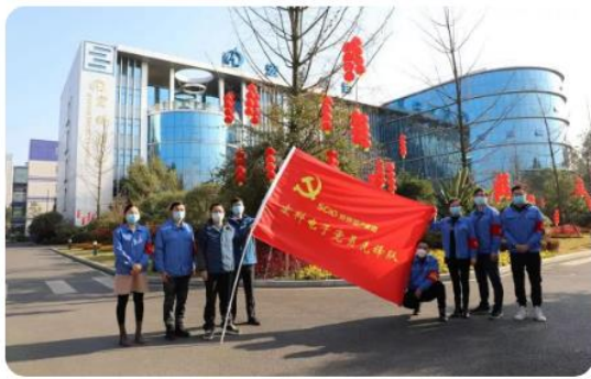
宏科电子党员先锋队

自新型冠状病毒肺炎疫情爆发以来，川投信产在川投集团党委的坚强领导下，紧急动员、全面部署，充分发挥党建引领作用，依托“五彩党建”工作机制，组建多支党员先锋队、志愿者服务队，利用所属企业互联网+、大数据、电子元器