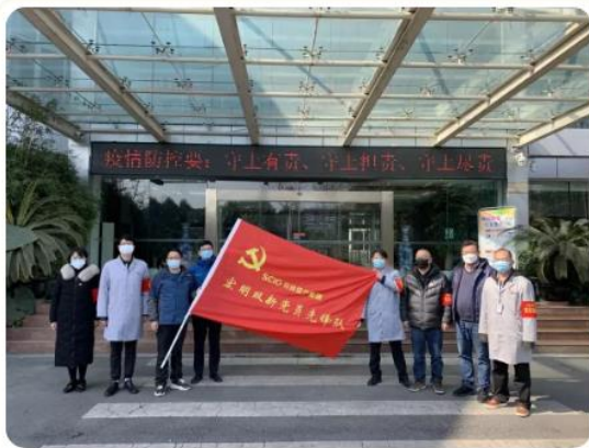
宏明双新党员先锋队